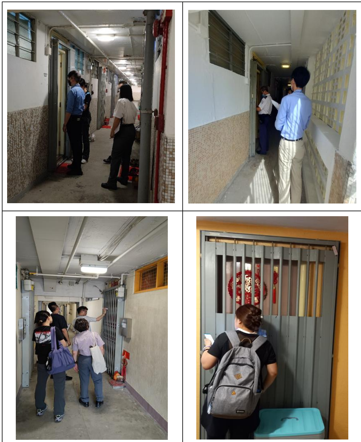
图 3：屋村管理人员进行家访的情况