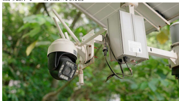
監測系統可實時監測排水口情況，適時作出跟進。